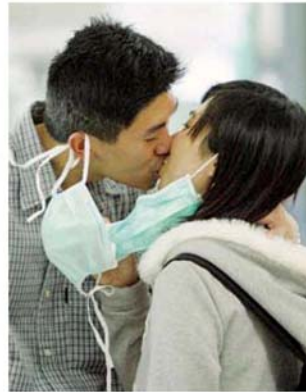
Fiducia A Hong Kong nel 2003 durante la Sars. A destra Ilaria Capua, massima esperta di virus animali (Reuters e Ansa)

Non solo: il governo olandese ha presentato, in occasione dell'ultima assemblea generale dell'Orga-